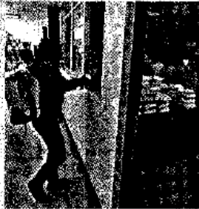
■ Los aspirantes a maestros de Michoacán y Oaxaca tuvieron que examinarse en el DF.

Un año y seis meses después, tras decenas de reuniones y acuerdos firmados con Gobernación, los pasados 12, 13 y 19 de julio la CNTE, junto con estudiantes normalistas, impidió la aplicación de las pruebas para el servicio docente en Oaxaca y Michoacán.