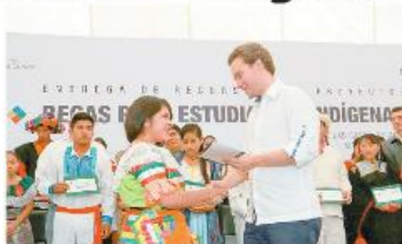
El gobernador de Chiapas.

Lo anterior es parte de las estrategias que se realizan en Chiapas para combatir la