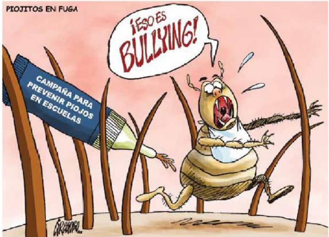
PIOJITOS EN FUGA