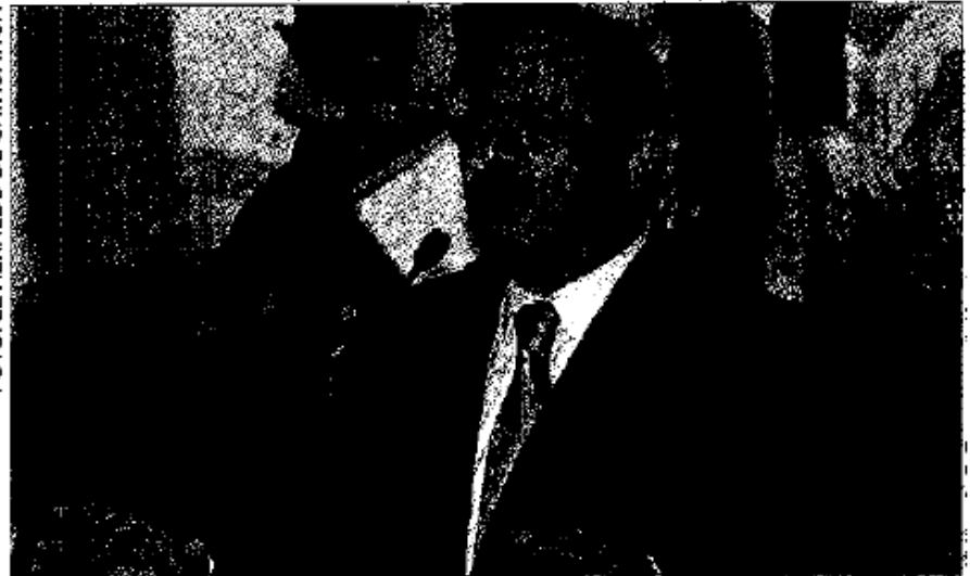
» CÉSAR DUARTE, gobernador de Chihuahua.