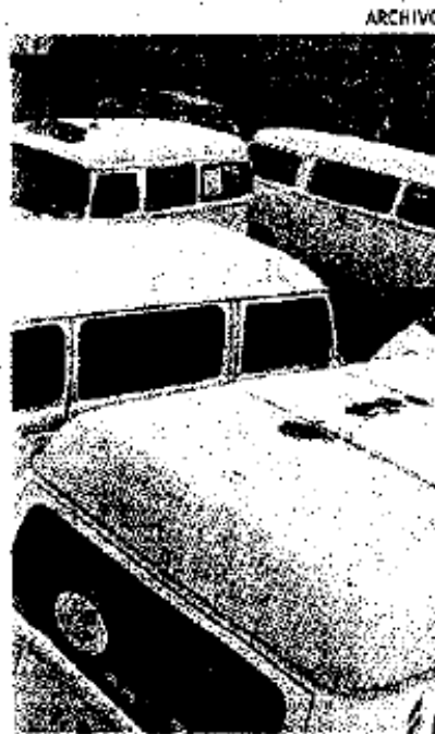
Unidades del Estado de México.

En ese sentido, agregó que los municipios de Ecatepec, Nezahualcóyotl, Naucalpan, Tlalnepantla, Chimalhuacán, Toluca, Atizapán de Zaragoza, Valle de Chalco, Tultitlán y