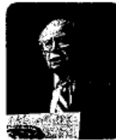
José Narro Robles.

En fin, el tema da para varios análisis y la próxima semana volveré a él. Por lo pronto, apunto un aspecto que me parece de la mayor importancia. El Presidente responsabilizó a las secretarías de Energía y Educación, así como al Conacyt, para que presenten el programa estratégico ya mencionado, mismo que representa un reto enorme. Ante una materia tan compleja, y con el reloj en marcha, ¿no sería necesario que ese grupo se apoyara en una especie de "fuerza representada" por los representantes de la Anuias y, desde la Secretaría General Especial a la UNAM