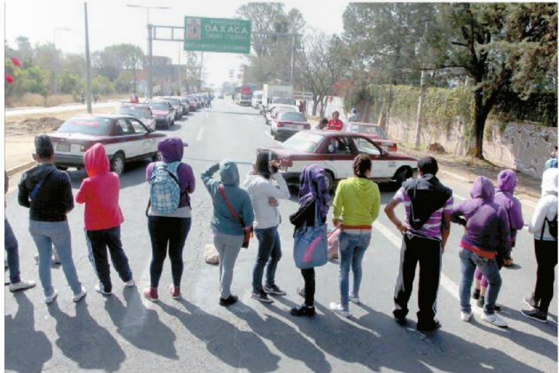
Bloqueo de normalistas en uno de los accesos a la capital de Oaxaca.

Con el apoyo de la CNTE, los aspirantes a maestros exigen la entrega de mil plazas de manera automática; alistan boicot para el día de la prueba