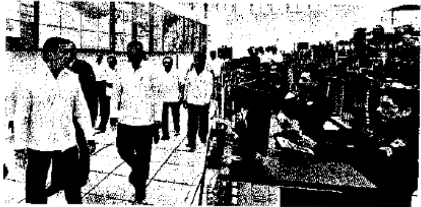
El Secretario de Gobernación realizó una gira por Yucatán.

desde el año pasado y que cualquier plática, diálogo o acuerdo que se pudiera tener en nada va a dañar la reforma educativa que logramos todos el año pasado”, dijo ayer Osorio Chong.