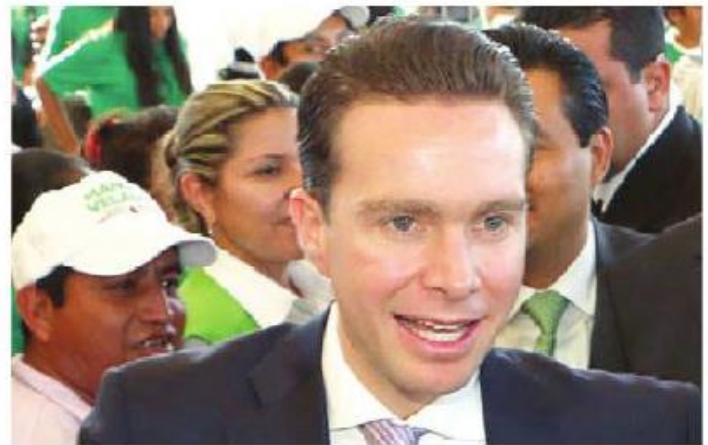
El gobierno que encabeza Manuel Velasco dará un fuerte impulso a la calidad educativa.

En este contexto, el gobierno estatal refrenda su compromiso de impulsar la calidad educativa, como lo establece uno de los objetivos del eje de bienestar, con el que Chiapas avanza.