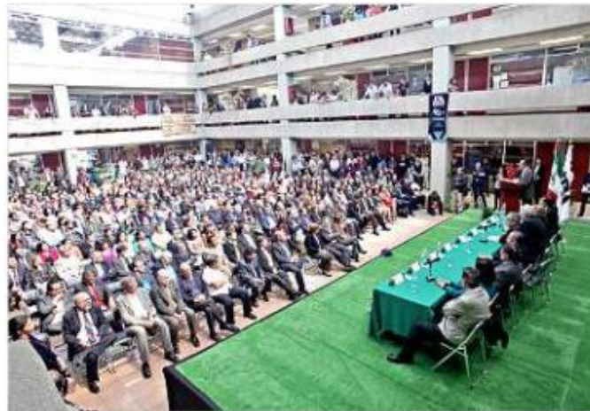
El rector recibió aplausos de los asistentes a la ceremonia.

"Esta es una crítica más profunda que el nombramiento de Nateras, es una crítica a las estructuras de la Universidad,