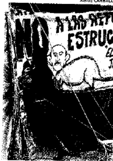
Campamento en el DF.

Los profesores aceptaron que la división interna ha propiciado la necesidad de "nombrar a los delegados que asistirán al tercer