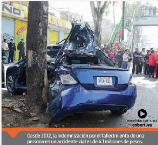
Desde 2012, la indemnización por el fallecimiento de una persona en un accidente vial es de 4.1 millones de pesos.

Además, estos 299 mil millones de pesos equivalen prácticamente al presupuesto que se destina a la educación básica, y que según datos de la Secretaría de Hacienda y Crédito Público (SHCP) este año alcanzarán 292 mil millones de pesos para la