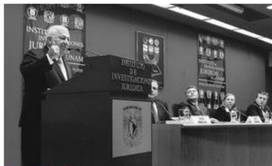
ENCUENTRO. El secretario de Educación Pública, Emilio Chuayffet, al dictar su ponencia en el foro Reforma Educativa, desarrollado en el Instituto de Investigaciones Jurídicas de la UNAM.

Anunció que en breve la secretaría emitirá los lineamientos con los cuales iniciará la autogestión en las escuelas de educación básica, así como las reglas generales que regularán el consumo de alimentos nutricionales.