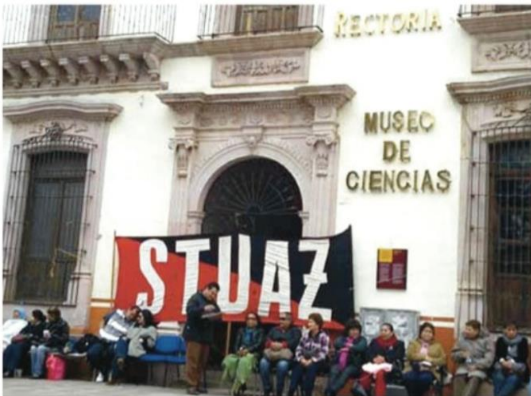
Los inconformes amagaron con mantener hoy el paro escalonado en los edificios de las unidades académicas de Nutrición y Turismo.

Los trabajadores de la universidad paralizaron actividades en la rectoría