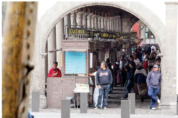
..ECCIÓN. Impresores sugieren a sus clientes no usar documentos apócrifos para buscar trabajo en el gobierno; en las empresas privadas “pasan sin trabas”, dicen

Justo ahí suele detallarse qué documento conviene al cliente. Los impresores recomiendan no usarlos cuando se busca trabajo en oficinas de gobierno, porque “ahí verifican que sea bueno”. Es más flexible en empresas pequeñas, “pasa rápido, sin tanta traba”, confiesa un impresor de unos 61 años de edad.