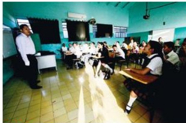
AVANCE. Los maestros buscarán redoblar el paso para poner al corriente a los alumnos tras los días perdidos.

“Como ciudadana creo que el que se hayan suspendido las clases está muy mal por la situación que hemos padecido, pero ya nos tocó vivir en esta región de Tierra Caliente, que en los últimos años se ha visto empañada por estos sucesos. Pero estamos aprendiendo a vivir en esta situación tan triste por la violencia. Ahora a trabajar a marchas forzadas”, dijo.