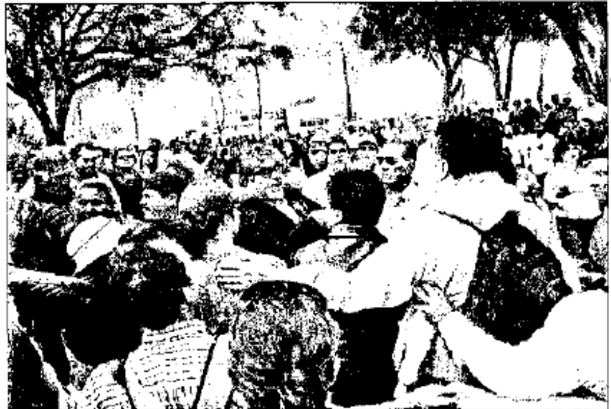
AGRESIONES. En Xalapa, maestros inconformes se enfrentaron a la policía.

Al percatarse de ello, los maestros empezaron a empujar las va-