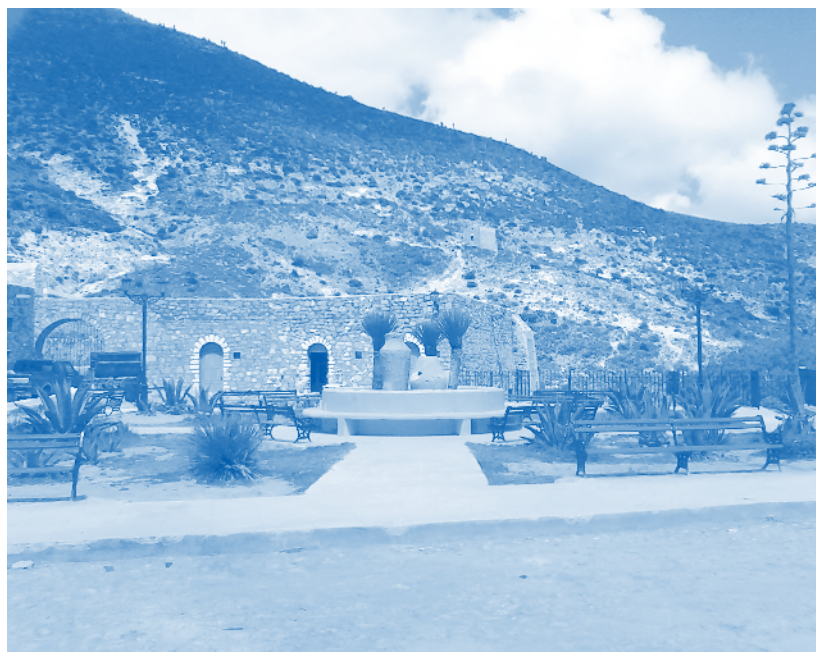
Real de Catorce

La declaración establece que las Unidades y Subsedes UPN forman una red instalada, distribuida, flexible y compartida que opera con profesores especializados para conducir procesos de formación de profesionales de la educación, inter-