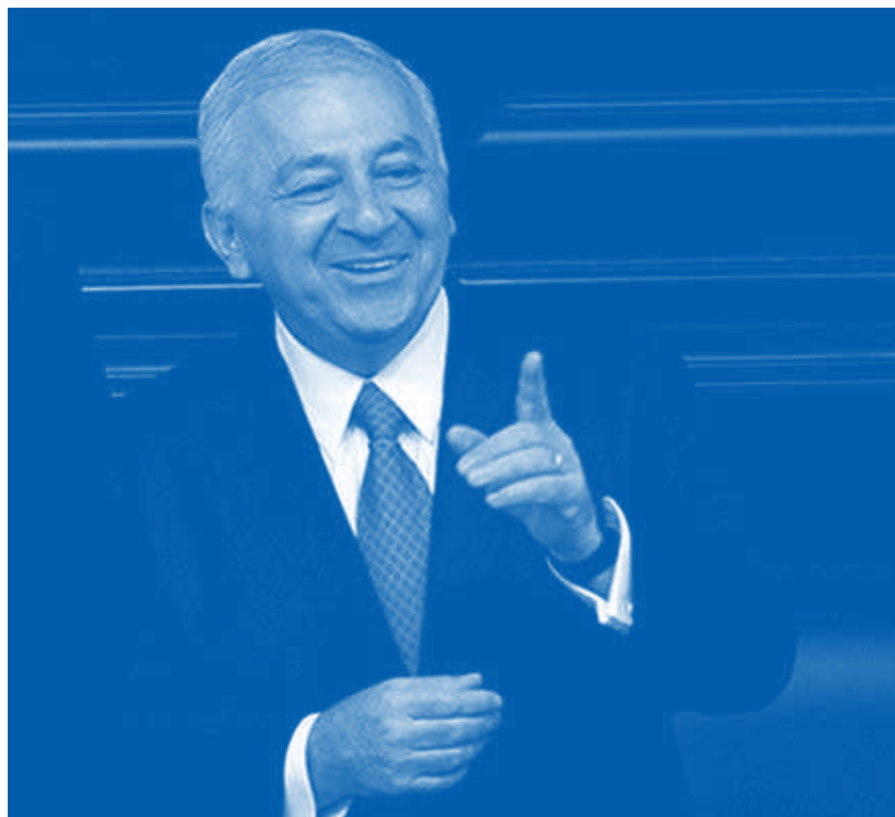
Emilio Chuayffet Chemor

“Para ello, se impulsará una reforma legal y administrativa en materia educativa con tres objetivos iniciales y complementarios entre sí. Primero, aumentar la calidad de la educación básica que se refleje en mejores resultados en las evaluaciones internacionales como PISA. Segundo, aumentar la matrícula y mejorar la calidad en los sistemas de educación media superior y superior. Y tercero, que el Estado mexicano recupere la rectoría del sistema educativo nacional, manteniendo el principio de laicidad”. ◉