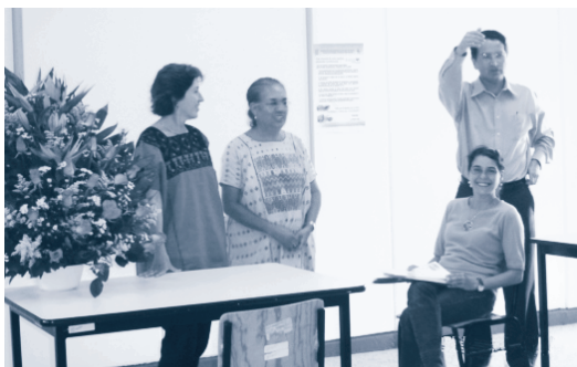
Derechos de la infancia en la unidad UPN Cuernavaca