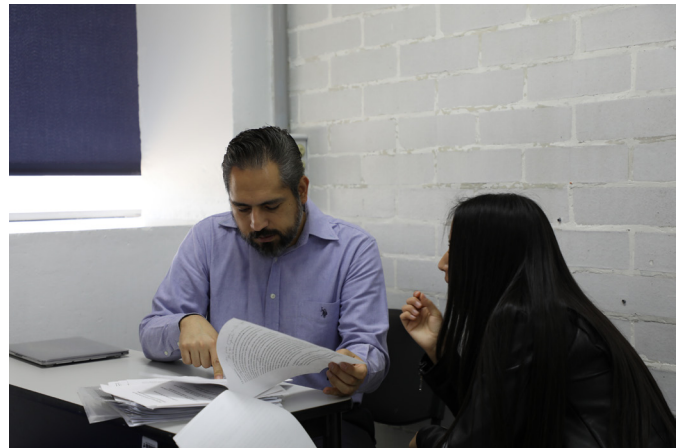
Imagen de archivo

Como parte de los trabajos para su implementación, se llevó a cabo en la Unidad 092, Ajusco, una reunión en la que se dieron a conocer los aspectos