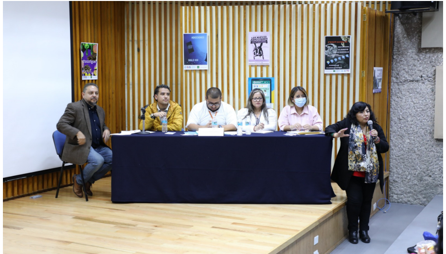
Conferencia contra adicciones

En ese sentido, estudiantes de licenciatura destacaron que, al platicar con las comunidades estudiantiles, se han dado cuenta de que todas las personas tienen, de alguna forma, un acercamiento al mundo de las adicciones, ya sea por algún familiar o por su propio entorno. Es por ello que establecer contacto de forma empática es esencial para tratar este tipo de temas. "Los estudiantes, al conocer nuestras propias experiencias, confían más en nosotros, así logramos una mejor conversación", afirmaron.