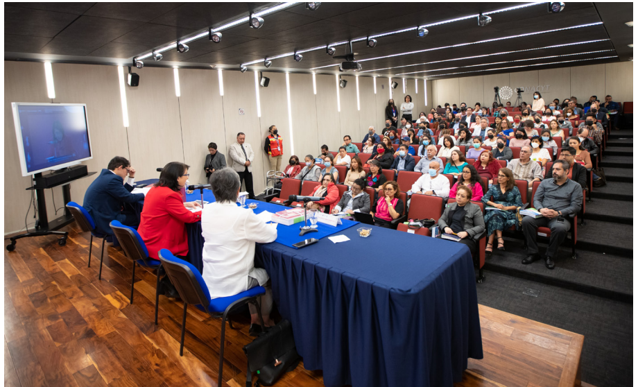
Gran asistencia de la comunidad UPN

Por otro lado, la directora general del CONACYT indicó que la ley (ya aprobada el 29 de abril en el Senado) promueve, entre otras bondades, el avance del conocimiento universal, fortalece la soberanía