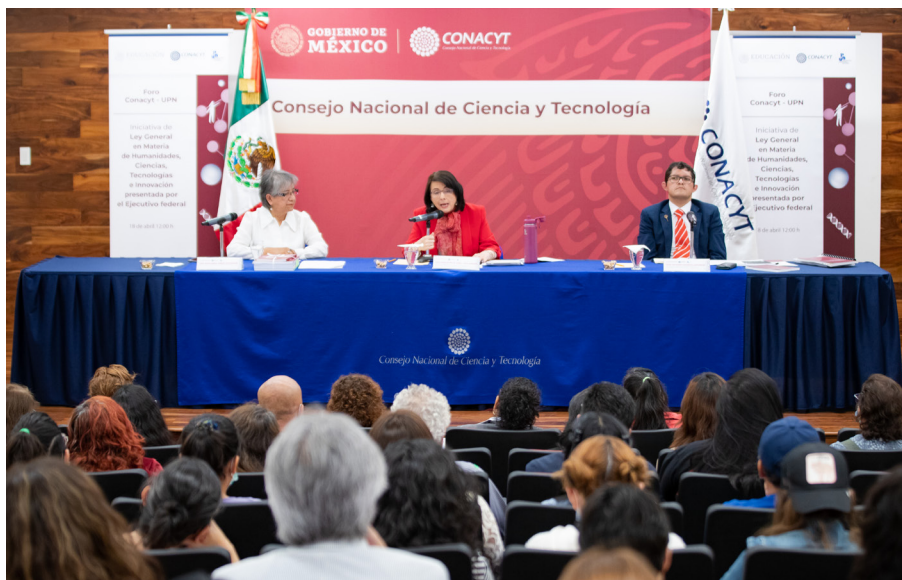
Durante el foro en el CONACYT