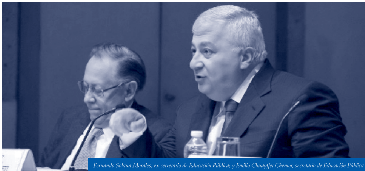
Fernando Solana Morales, ex secretario de Educación Pública; y Emilio Chuayffet Chemor, secretario de Educación Pública

Con motivo del 70 aniversario de la fundación de El Colegio Nacional, la sala de videoconferencias de la Unidad Ajusco de la Universidad Pedagógica Nacional (UPN), se enlazó con el aula mayor de la septuagenaria institución para transmitir la tercera mesa redonda sobre Educación, en la que participaron Ruy Pérez Tamayo, moderador; Emilio Chuayffet Chemor, secretario de Educación Pública; y los ex secretarios de Educación Pública, Fernando Solana Morales y Miguel Limón Rojas.