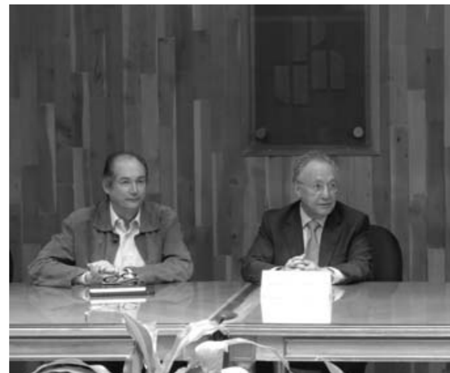
Ernesto Díaz Couder Cabral y Tenoch Cedillo Ávalos

“Es momento de ir más allá de lo que se ha logrado en términos de resultados educativos. Hay que emprender tareas apoyadas en el trabajo colegiado que se desarrolla en la Universidad, para que los estudiantes alcancen aprendizajes similares y comparables al acreditar un curso”, puntualizó el rector.