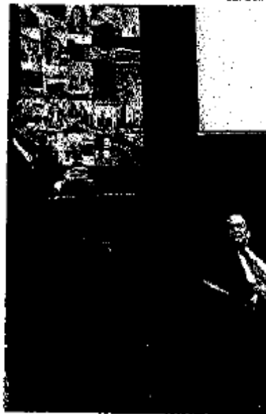
Mensaje del titular del ITESM.

"Este libro refleja una síntesis de miles de vidas. Y hablo de miles porque han sido miles de profesores que en 70 años hemos dejado la vida en esta institución con una vocación importante y para aportarle a México lo más valioso que tiene: su gente. Trabajamos porque queremos formar una nueva generación... Queremos líderes con un fuerte sentido emprendedor", expuso.