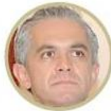
Miguel Ángel Mancera