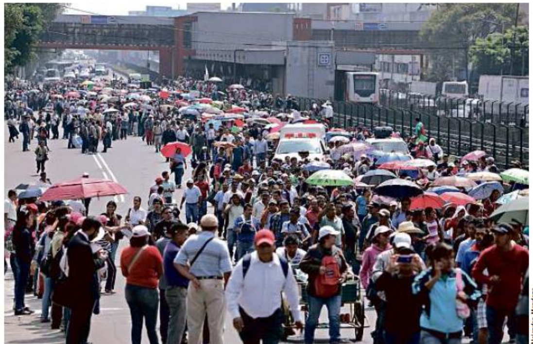
Y DESQUICIAN TRÁNSITO. Cientos de maestros marcharon ayer sobre Tlalpan para protestar contra la reforma educativa, lo que generó caos vial en esta importante arteria.