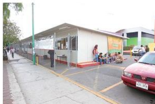
SITUACIÓN. Alumnos de la preparatoria del GDF de Venustiano Carranza toman clases en el estacionamiento de la delegación.

En conferencia, Puebla López anunció que al fin empezarán a construirse los planteles definitivos de las prepas de Venustiano Carranza, ubicada en el estacionamiento del edificio delegacional, y el de Iztapalapa 4, que comparte salones con una secundaria en la colonia Miravalle.