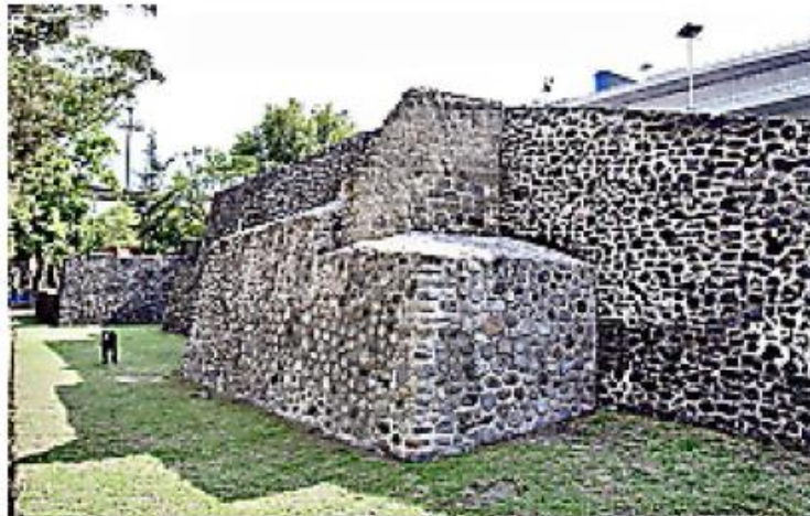
> La zona exhibe una construcción de forma piramidal a la que fueron agregadas, en etapas posteriores, otras dos edificaciones.