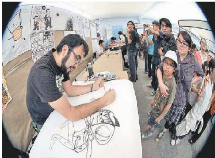
En el encuentro también tomarán parte artistas plásticos.