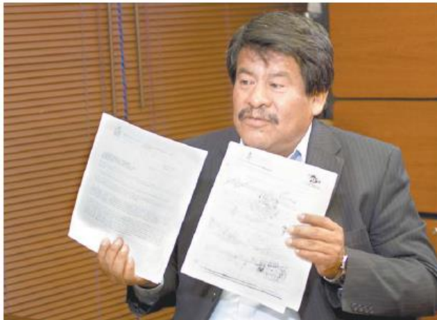
La entrevista en El asalto... saldrá al aire hoy por la noche.