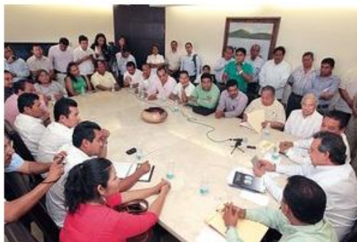
APOYO. Líderes del SUSPEG dieron su respaldo al gobernador Ángel Aguirre, por la aplicación de las reformas a la Ley Educativa. (Foto: )

Por otra parte, los secretarios seccionales del Sindicato Único de Servidores Públicos del Estado de Guerrero, encabezados por su líder, David Guzmán Sagredo, manifestaron su respaldo y solidaridad al gobernador Ángel Aguirre Rivero, por la aplicación de las reformas a la Ley Educativa. "Nosotros hemos analizado a fondo la Reforma Educativa y laboral y por eso los agremiados al SUSPEG hemos decidido asimilarla y decir que estamos de acuerdo en que se ponga en marcha en nuestra entidad", aseguró Sagredo.