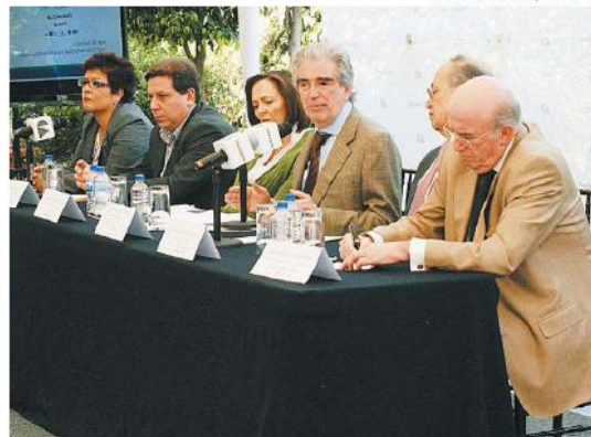
Proyectar nuestra cultura a través de las letras, prioridad: Tovar.

Así, el monto del apoyo para las tres categorías del programa se incrementa: para los proyectos de traducción y publicación de libros especializados en literatura y humanidades pasa de cinco a 15 mil dólares; en los libros de arte de 15 a 25 mil dólares y en