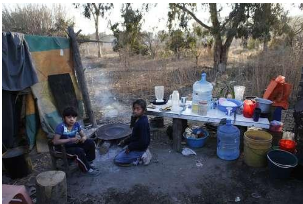
La desigualdad, uno de los grandes conflictos de los mexicanos. La imagen fue captada en la colonia Carlos Salinas de Gortari de Valle de Chalco, estado de México

Pactan evaluar las fortalezas y debilidades del sistema científico y tecnológico