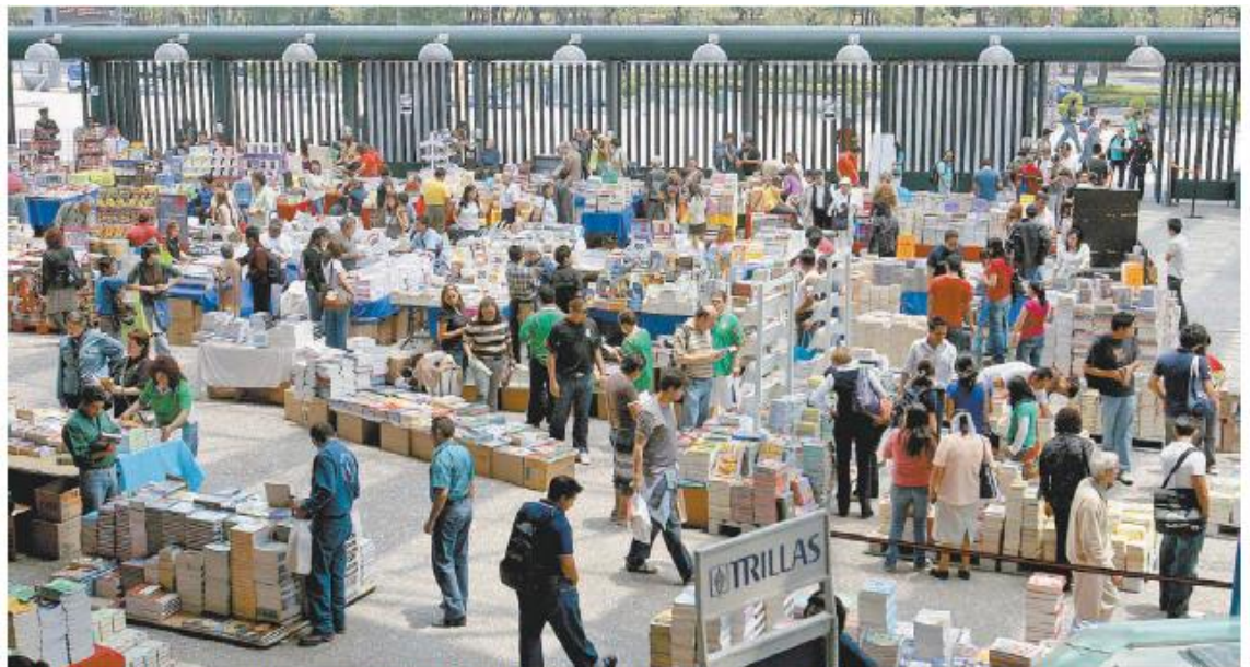
Se reunirán 135 expositores con más de 10 mil títulos a la venta, desde 10 pesos o descuentos de entre 60 y 80 por ciento.

En el encuentro se reunirán 135 expositores con 250 fondos editoriales y más de 10 mil títulos a la venta, con libros desde 10 pesos o descuentos de entre 60 y 80 por ciento, lo que es importante porque permite a los editores la posibilidad de deshacerse de sus inventarios de bodega y, en consecuencia, disminuir los costos de almacenaje por libros no vendidos.