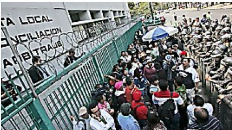
> Los manifestantes, trabajadores y académicos, fueron rodeados y contenidos por los escudos de los policías contra una barda metálica.