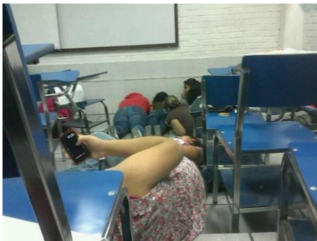
Imagen difundida vía Twitter de una escuela de la ciudad de Monclova, Coahuila, durante las balaceras de ayer