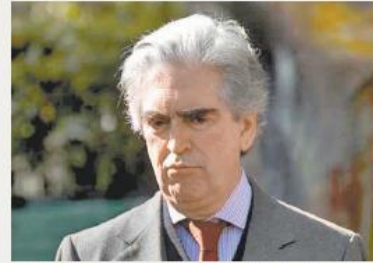
Rafael Tovar y de Teresa, titular de Conaculta.

En la reunión que sostuvo el lunes 25 de febrero con la Comisión de Cultura de la Cámara de Diputados, Tovar aludió al