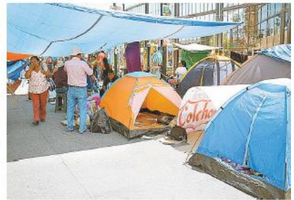
Profesores trasladaron su protesta frente al palacio de gobierno.

En Michoacán, el secretario de Gobierno estatal, Jesús Reyna, no descartó un posible desalojo luego de que estudiantes normalistas determinaron mantener por tiempo indefinido el bloqueo de la principal avenida de Morelia