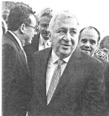
Emilio Chuayffet, titular de la SEP manifestó que la meta de cobertura del 90 por ciento en educación media superior es una utopía.

EMILIO CHUAYFFET Secretario de Educación