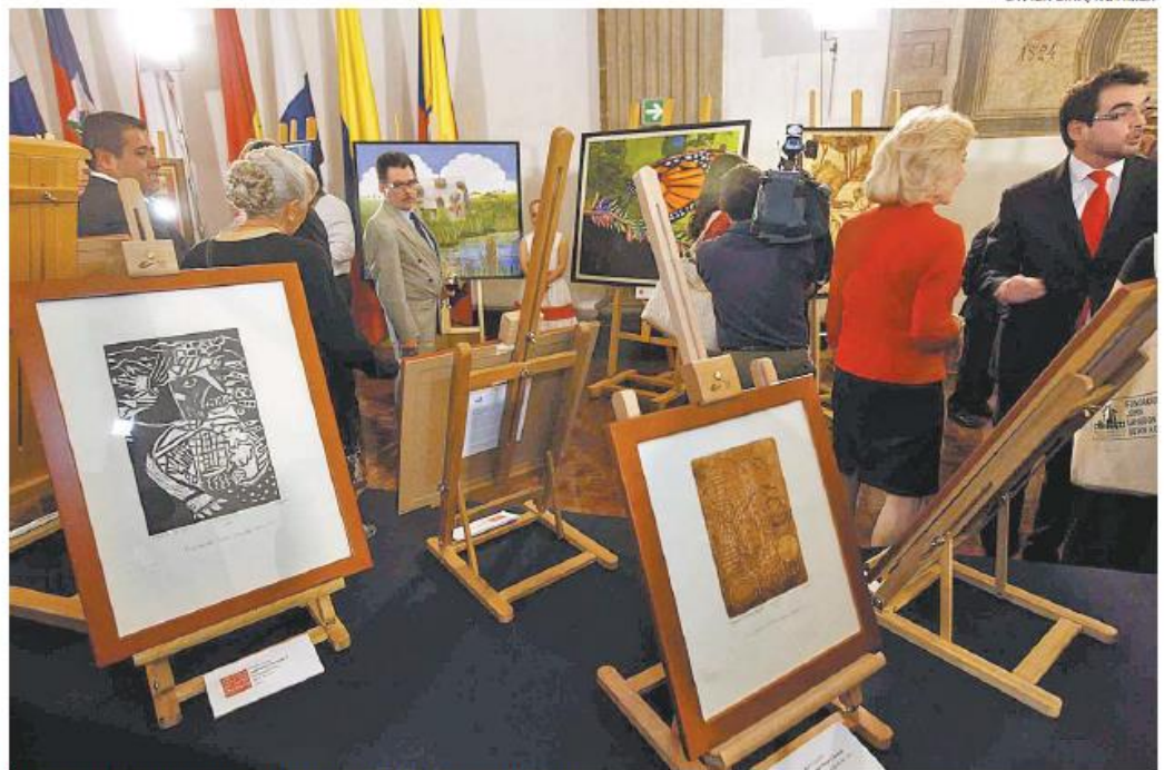
En la exhibición figuraban 31 pinturas y 23 grabados.

La Organización de las Naciones Unidas declaró oficialmente el 21 de marzo como el Día Mundial del Síndrome de Down. Esta resolución