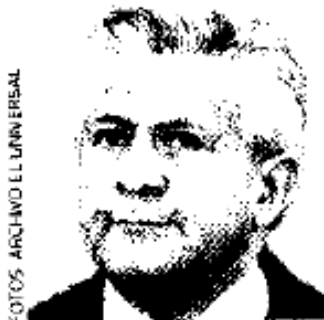
JUAN MIGUEL ALCÁNTARA SORIA

LOS ENTRETRELONES de la reunión de la Red Nacional de Municipios por la Seguridad y la Convivencia Ciudadana dejaron al descubierto el desastre en el uso de los recursos públicos y en la alimentación de las bases de datos para el combate al crimen en el país. Para empezar, algunos alcaldes enviaron a sus representantes al encuentro con Juan Miguel Alcántara Soria , secretario ejecutivo del Sistema Nacional de Seguridad Pública. Eso sí, los enviados se quejaron de que los dineros del Subsemun no son suficientes: les dan