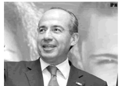
Felipe Calderón

El presidente alegró a los politécnicos. Más allá del creciente liderazgo de las mujeres —que tiene mucha más miga de la que aparenta—, el presidente hizo un discurso que alegró a los politécnicos.