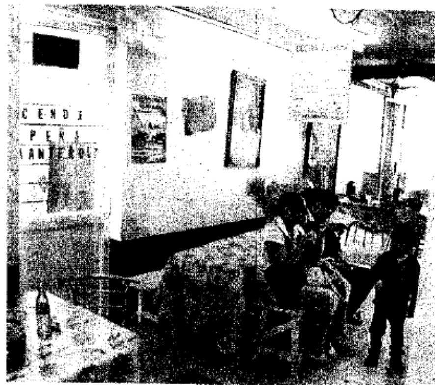
Quieren alejarlos de locales con riesgo, como negocios de comida

El funcionario comentó que junto con la Secretaría de Obras y Servicios local se han revisado los 356 Cendis que hay en la capital y se han detectado algunos problemas por lo que ya dieron inicio las adecuaciones.