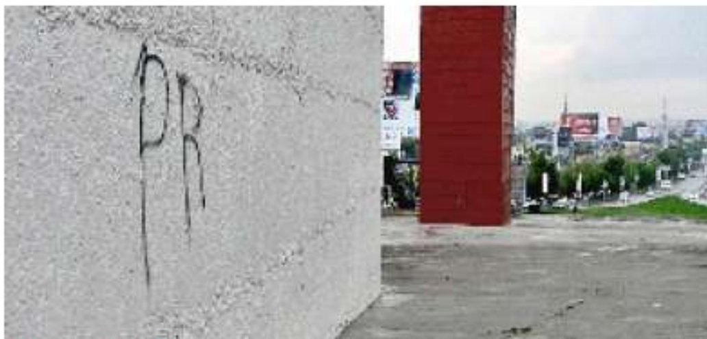
NAUCALPAN. Las Torres de Satélite fueron graffiteadas durante el cierre de campaña del PRI; también fue quebrada una de sus nuevas lámparas.