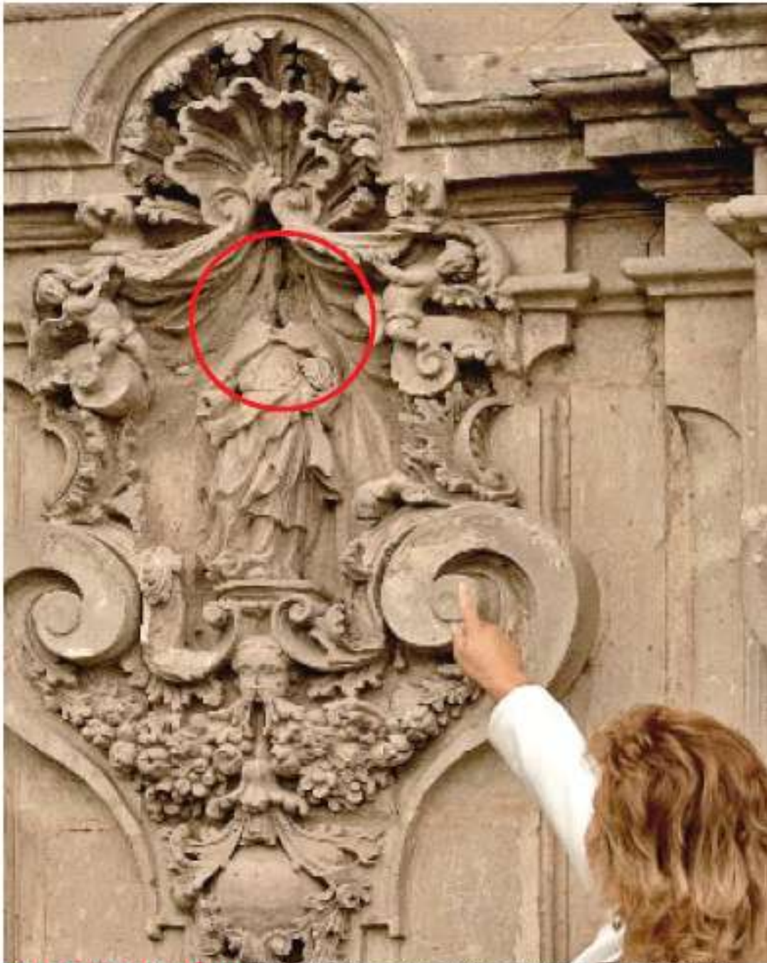
TEPOTZOTLÁN. El alto volumen de la música en los actos del PAN y PRI podría haber agravado las grietas existentes en el Museo del Virreinato.