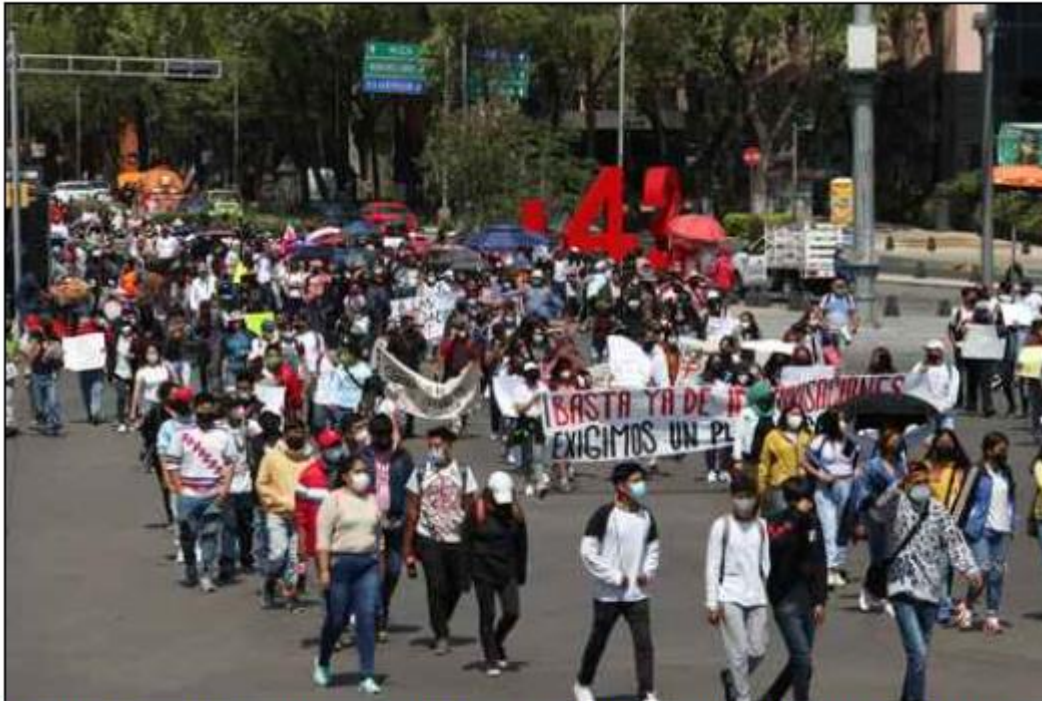
▲ Estudiantes del estado de México marcharon por Paseo de la Reforma para exigir sean vacunados y así regresar a tomar clases presenciales.