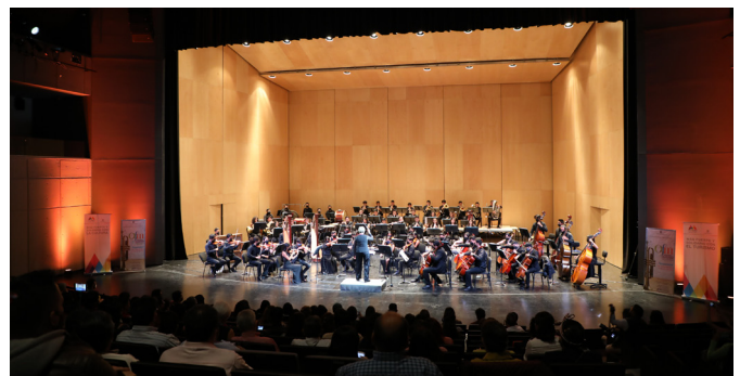
Concierto en el Centro Cultural Mexiquense de la Universidad Anáhuac