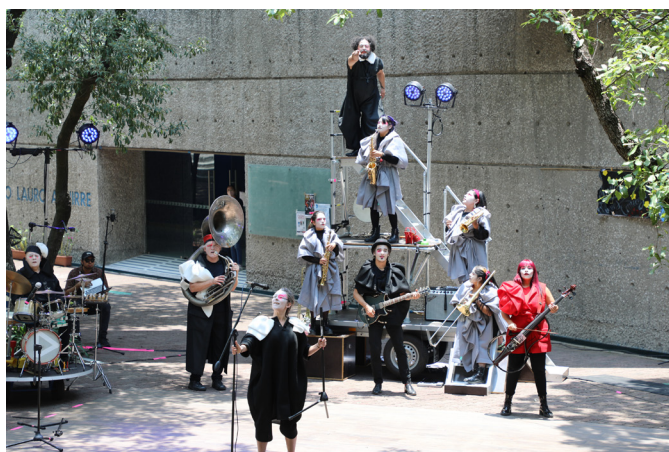
Mr. Moon , en la explanada de la Unidad Ajusco

En su gira por nuestro país, la compañía Moon Cabaret , acompañada por el ensamble Viento Florido de Oaxaca, ofreció en la explanada frente a la librería Paulo Freire, de la Unidad Ajusco, un espectáculo vivaz, en el que, guiado por una extravagante diva como directora, un grupo de payasos y músicos puso énfasis en un tema que lacera a la sociedad en la actualidad.