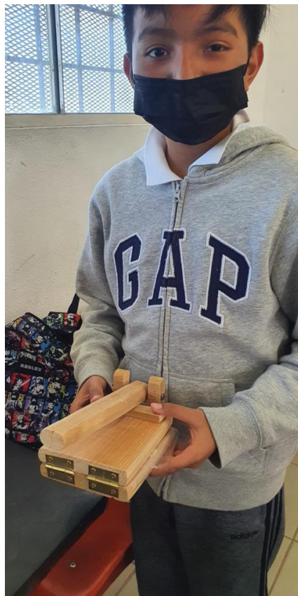
Niño con utensilio para hacer tortillas de maíz