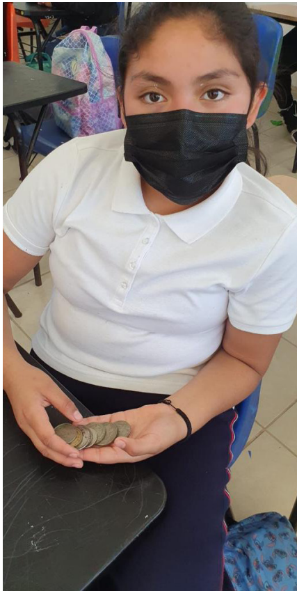
Niña nos presenta sus monedas