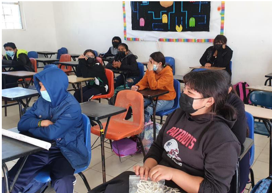
Salón de clases de la primaria 'Ve'e Tu'un Xavi'