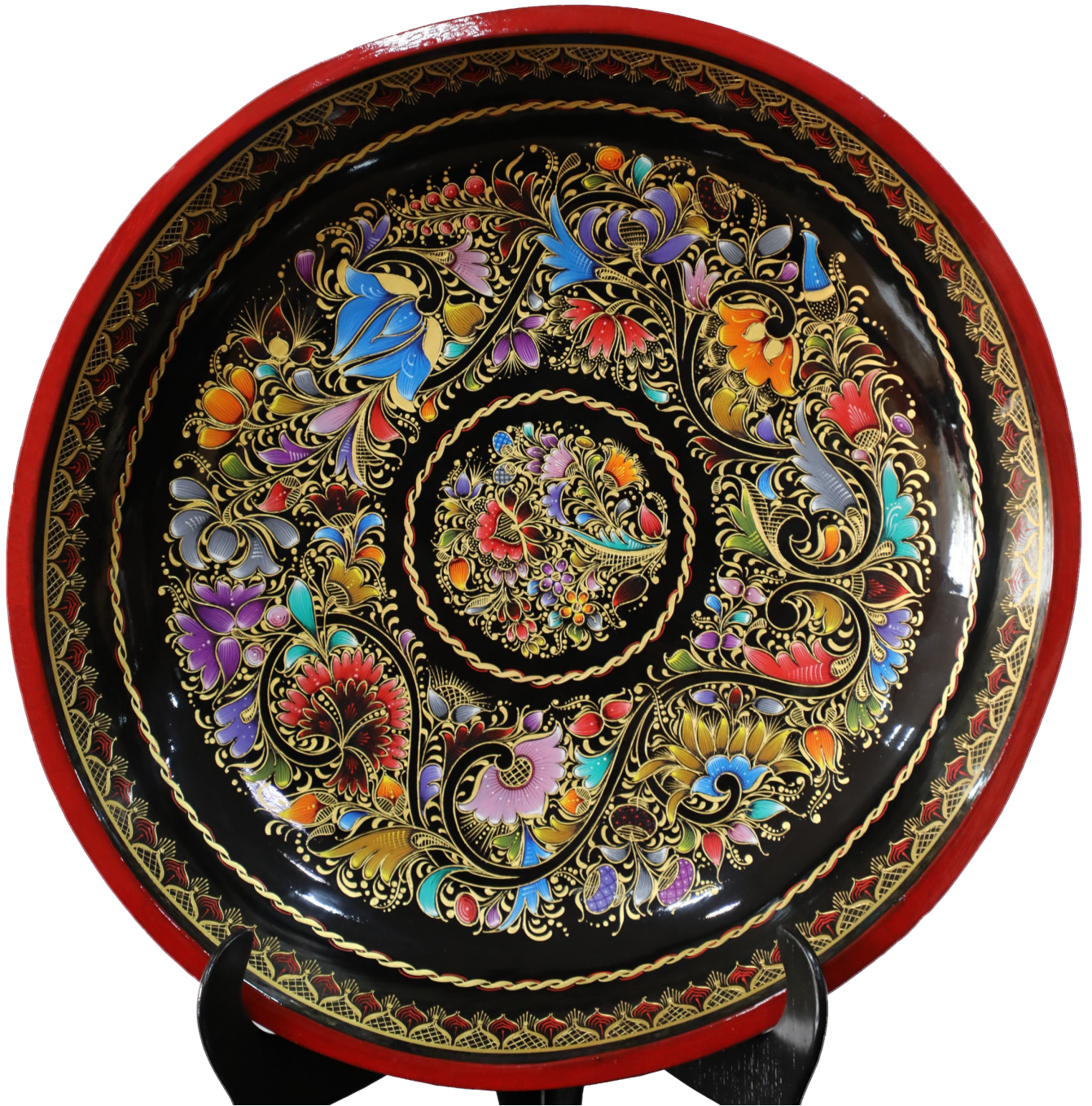
Artesanía del estado de Michoacán