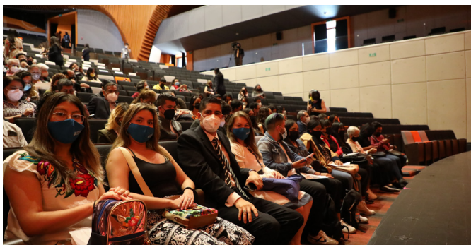
Nuestros estudiantes en primera fila

Nuestros estudiantes de las Unidades 094, Centro; 095, Azcapotzalco; 096, Norte; 098, Oriente, y 099, Poniente de la Ciudad de México, estuvieron en primera fila y disfrutaron de este programa que contempló una selección muy acertada de composiciones como la Obertura Festival Académica, Op. 80, que compuso Johannes Brahms después de que le concedieron el Doctorado honoris causa por la Universidad de Breslau, en 1880. Después continuaron con la única ópera de Ludwig van Beethoven, Obertura Leonora N° 3, Op. 72b, que versa sobre cómo salvan la vida del esposo de Leonora, quien había sido encarcelado injustamente.