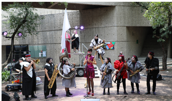
Snowapple es un colectivo de artistas de varias naciones

Con una mezcla de teatro, música, vanguardismo, surrealismo, humor y actualidad, llegó el colectivo Snowapple a la Unidad Ajusco para abrir, con su espectáculo internacional Mr. Moon , un espacio de diálogo y reflexión sobre la violencia contra las mujeres y el feminicidio en México.