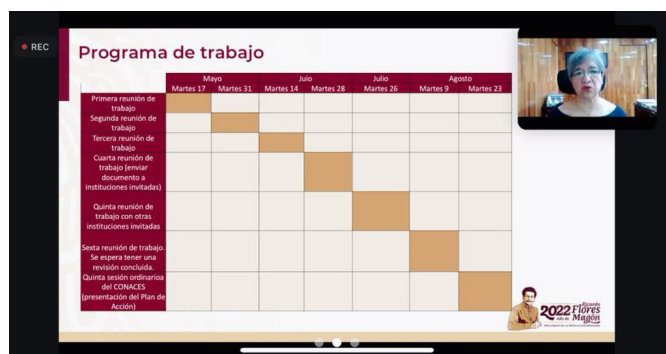
Durante la presentación del programa

La Comisión para la Elaboración del Plan de Acción de Igualdad de Género, creada a partir de la convocatoria emitida por el Secretariado Técnico Conjunto, presentó durante una primera sesión de trabajo el Documento Base para dar cumplimiento a la Ley General