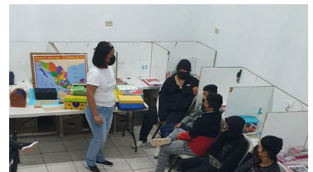
Salón de clases

grupo 6° B; posteriormente, se realizaron sesiones con otro grupo de 6° grado, con lo que se alcanzó un impacto en 73 alumnos y alumnas.