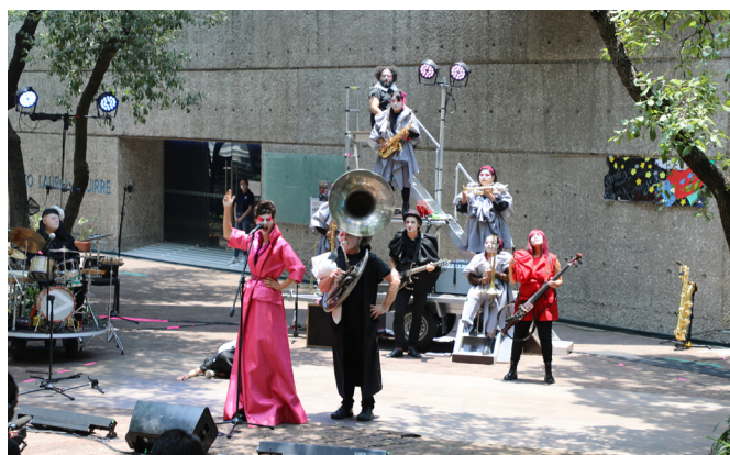
Espectáculo que busca la reflexión en temas de violencia de género