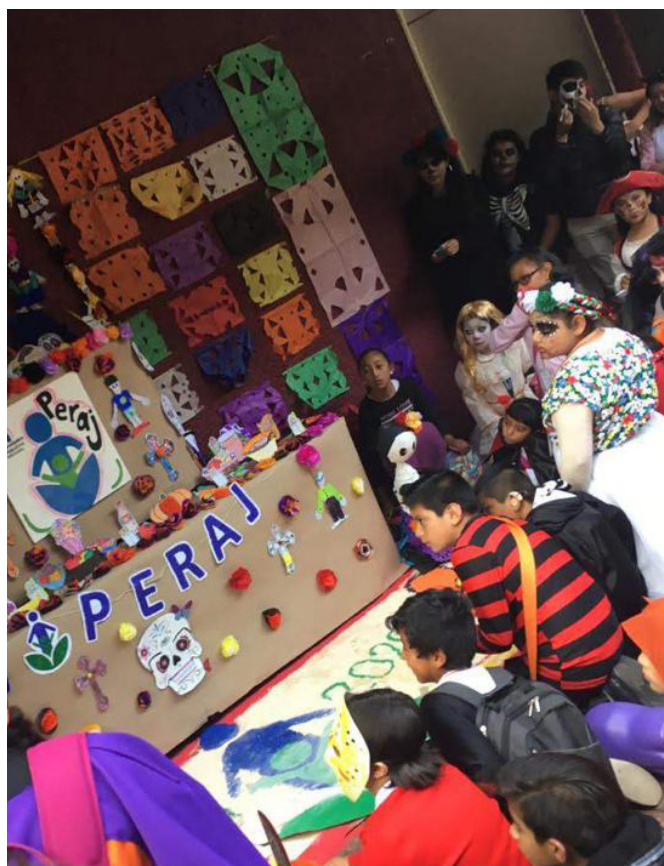
Amig@s del programa Peraj

Peraj Adopta un amig@ es un programa nacional que comenzó en 2007 con 55 binomios, y a la fecha cuenta ya con nueve generaciones en las que han participado 288 tutores y 290 amigos. Se apoya a estudiantes en condiciones vulnerables, de 4° de primaria a 2° de secundaria. Por medio de una relación significativa y personalizada entre mentor y amigo, se busca fortalecer la autoestima, las habilidades sociales, los hábitos de estudio y la cultura general.