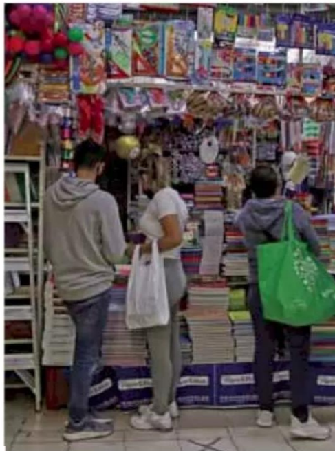
Alertas. 60% de familias enfrentan el regreso a clases con deudas por la cuenta de enero.

Aunque apuntó que, si se suma la proporción de papás que planean los desembolsos más altos, es posible observar que 36% gastarán entre siete mil 500 y más de 20 mil pesos en dichos rubros.