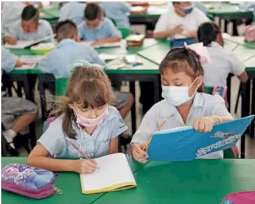
Baja. La organización Mexicanos Primero reveló que el gasto destinado a las escuelas de educación básica ha tenido decrecimiento en los últimos años, en términos reales.

Presupuesto educativo. Organizaciones alertaron que cientos de escuelas en el país presentan un deterioro generalizado por la falta de mantenimiento tras la pandemia por Covid-19