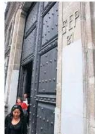
Marco curricular iniciará en el ciclo 2023-2024, informó la SEP.

Destacó que el humanismo se refiere a que estarán más enfocados a las emociones y a los talentos de los estudiantes, no todos son buenos para las matemáticas, pero se va a buscar que sean buenos en ese tema en la medida que sus posibilidades les alcance. ●