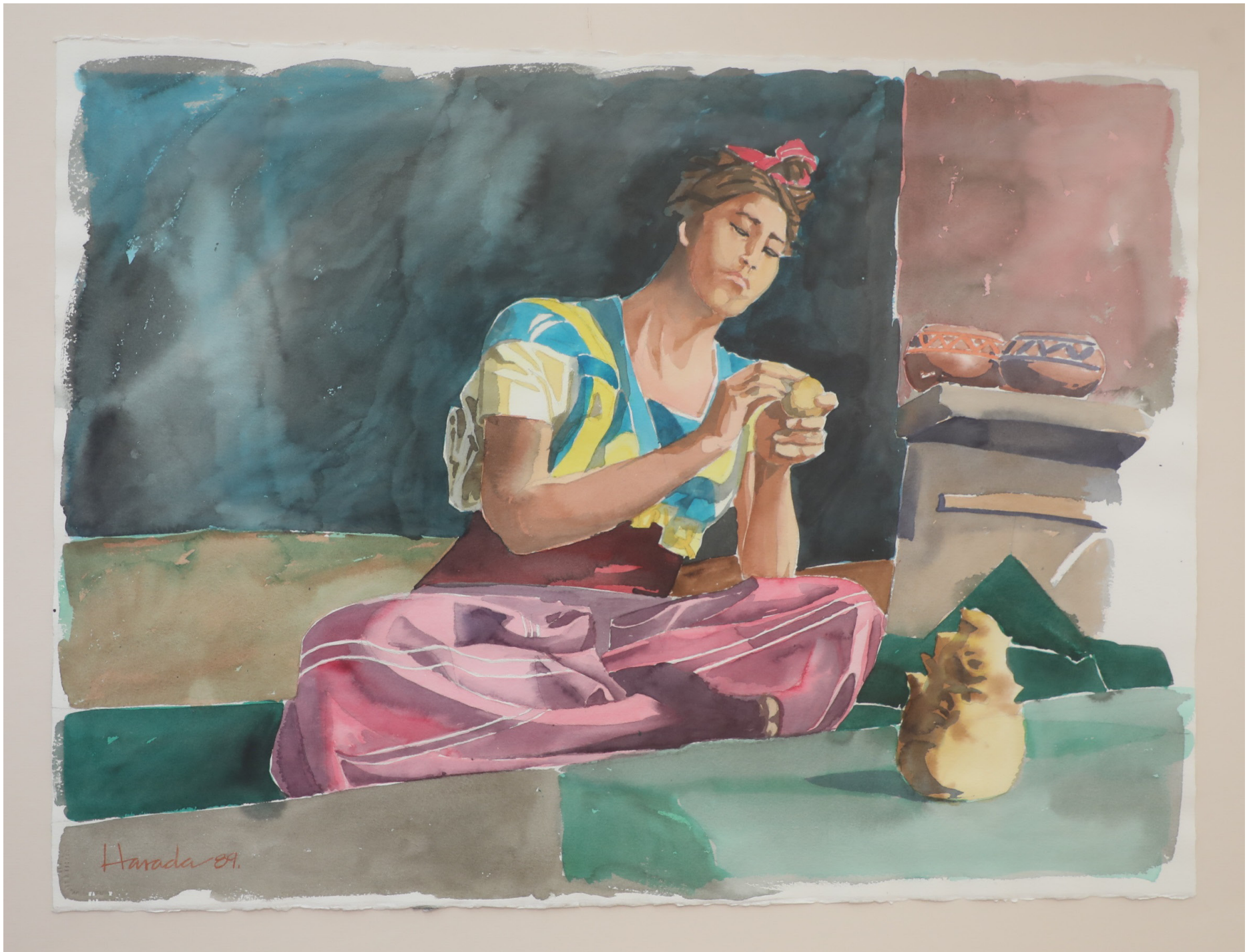
| Del pintor Harada, 1989