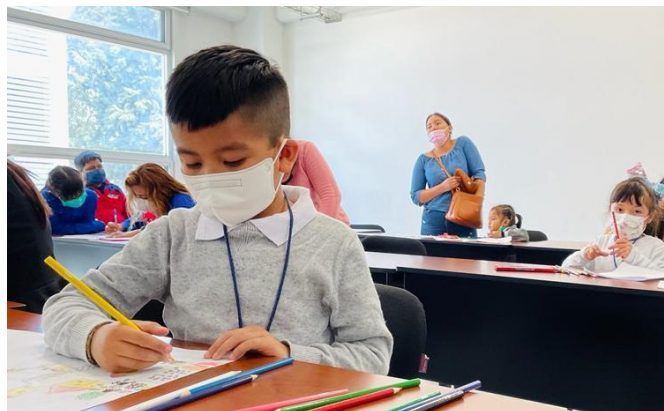
La Licenciatura en Desarrollo Infantil Integral está dirigida a personal docente en servicio en guarderías o estancias

Esta licenciatura es escolarizada y constará de nueve módulos a cursar en tres años. Se trata de una