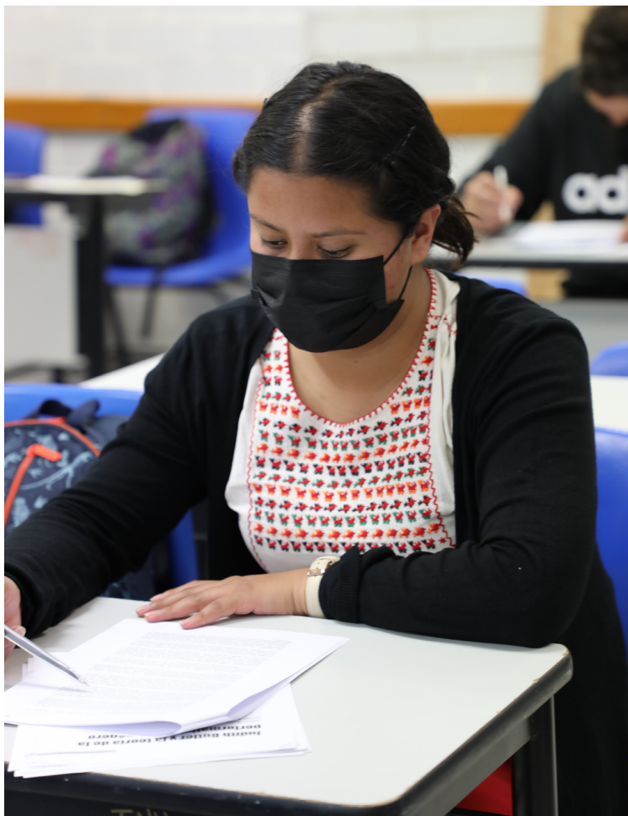
La aplicación del examen será el sábado 13 de mayo

Se debe esperar a que la documentación sea verificada por el área correspondiente y una vez que se valida se puede obtener el