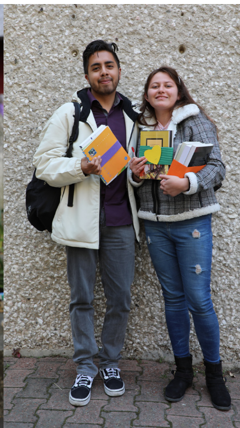
Algunos ganadores del rally "El libro perdido"