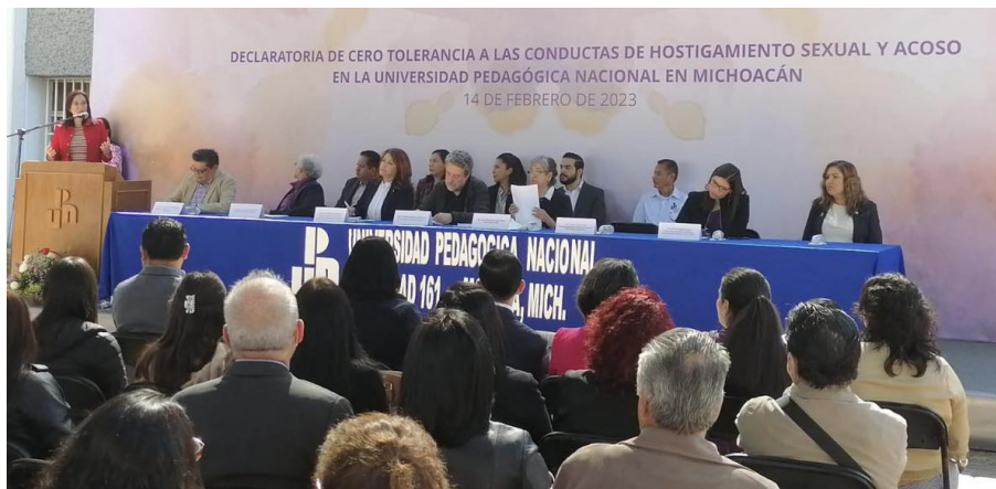
Durante la presentación en Morelia, Michoacán