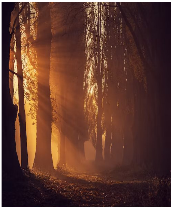
Imagen de archivo

Como parte de su exposición, la ponente hizo alusión a la importancia de la integración de contenidos para el logro de la formación completa de las y los estudiantes, desde la escuela hacia la comunidad. Al finalizar, cuestionó: "¿estamos dando la oportunidad a que nuestros niños puedan hacer una lectura del mundo y que lo conecten con la lectura de la palabra o simplemente imponemos la lectura de la palabra?". ♦ Andrei Escalante