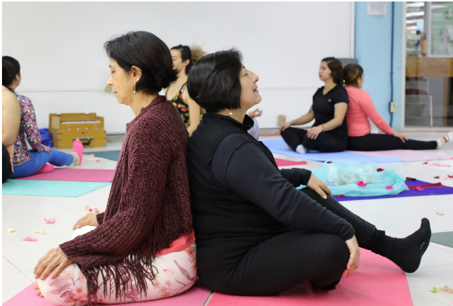
En la yoga para parejas se realizaron actividades en conjunto

Con libros, rock, yoga, conferencias y citas a ciegas, en la Unidad 092, Ajusco, se celebró el Día del Amor y la Amistad del 13 al 17 de febrero.