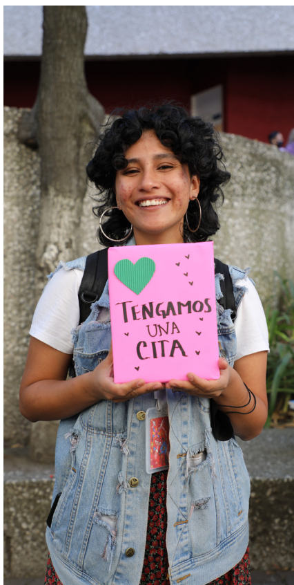
Estudiante recibe un paquete de libros por participar en el "El tendero de la poesía"