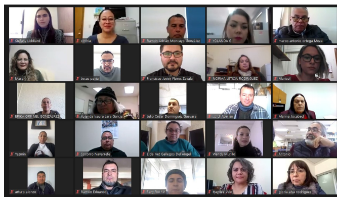
Talleres de actualización docente

El personal académico de las 12 Unidades de la UPNECH participó en un ciclo de conferencias que contó con la asistencia de 70 personas en cada una de las reuniones, las cuales tuvieron como objetivo actualizar a las y los docentes en temas pedagógicos y fortalecer las funciones sustantivas de la educación superior: docencia, investigación y difusión. ♦ Hugo León