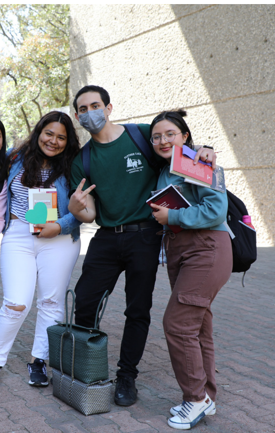
Participantes del rally "El libro perdido"