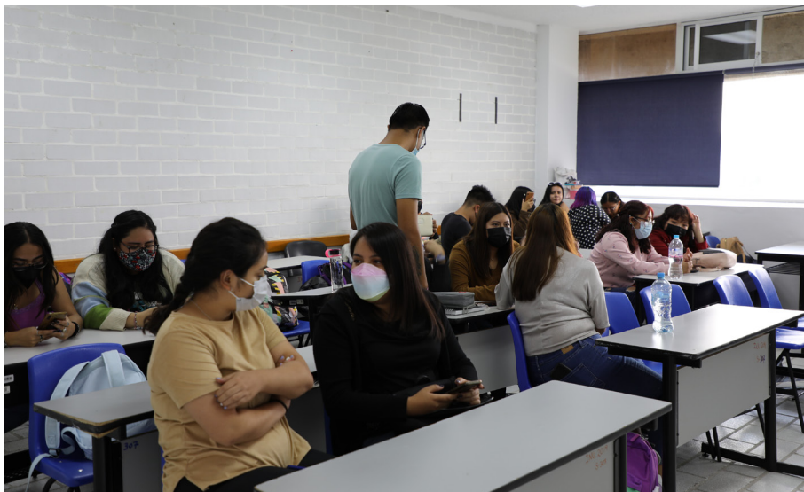
Si tenemos presentes las lenguas indígenas en nuestras aulas y pasillos podemos revitalizarlas

primera lengua que aprende una persona en su vida, "puede ser cualquier idioma de cualquier país, y en este sentido, las lenguas maternas son importantes porque a partir de ellas, sea la que sea, los hablantes muestran y reflejan una visión del mundo.