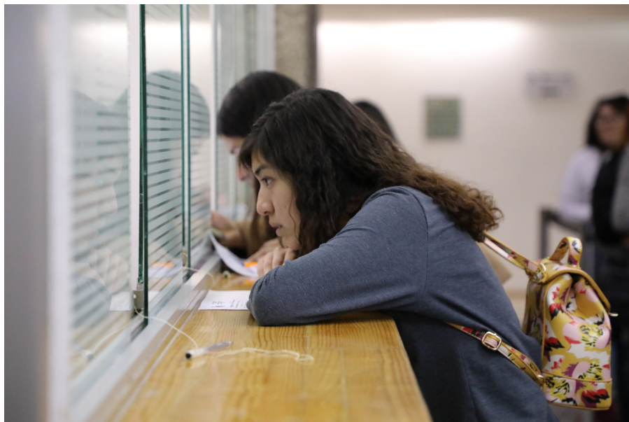
Algunos de los trámites exentos de pago son constancia de estudios, baja definitiva, baja temporal, historial académico, entre otros

Entre esos trámites se encuentran: constancia de estudios, bajas definitivas, baja temporal, historial académico, duplicado de certificado terminal y certificado parcial. No obstante, la inscripción, la reinscripción y los exámenes extraordinarios, así como aquellos documentos que se entreguen en impreso, continuarán generando cobro de derechos.