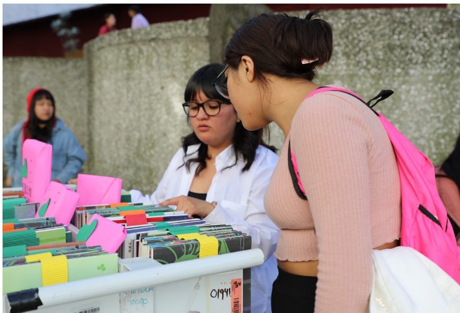
Estudiantes participan en la actividad "El tendero de la poesía"