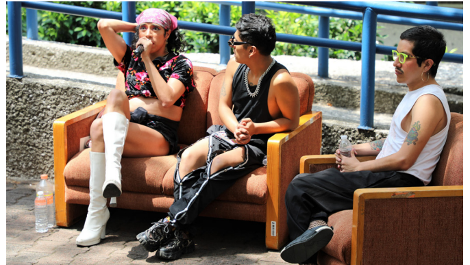
La comunidad de la Unidad O92, Ajusco, en el evento por el Día Internacional contra la Homofobia, Lesbofobia, Transfobia y Bifobia

"Debido a la patologización y la criminalización se han originado prejuicios y estigmas que hoy siguen