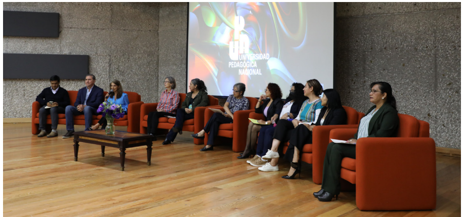
Ceremonia de bienvenida

Exalta que la UPN posee una larga historia. Alcanzará los 45 años y su nueva generación, conformada en más de 80 por ciento por mujeres, constituirá una parte