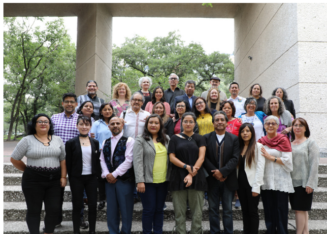
Egresados y docentes de la primera generación del Doctorado en Educación y Diversidad