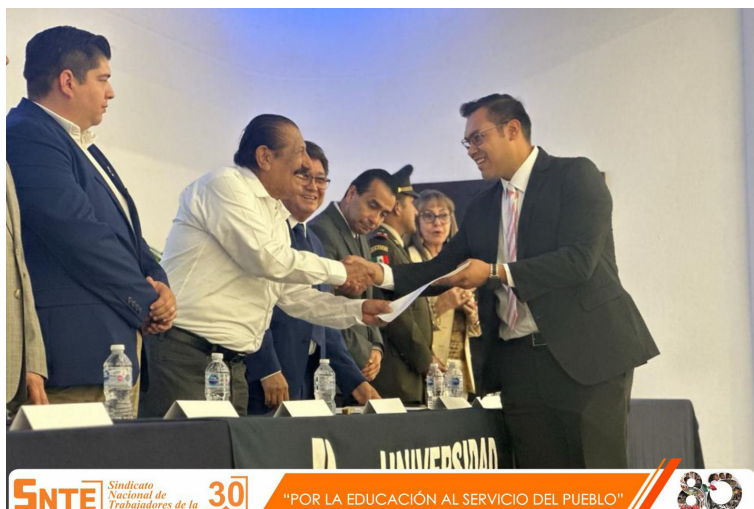
Unidad UPN 281, Tamaulipas