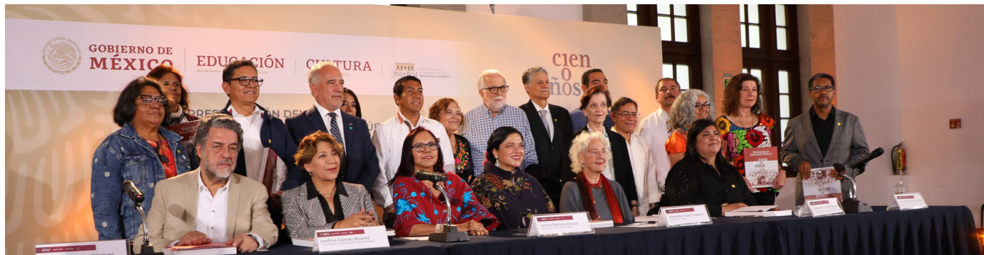
Durante la presentación del libro en el Complejo Cultural Los Pinos

El mediodía se acerca y el cielo se esfuerza en clarear. Una mujer de la tercera edad sale del metro Constituyentes. Alza los brazos e intenta saber si lloverá. Es el último viernes del mes: 28 de julio. Un policía la sigue con la mirada. Ella se encamina hacia el Complejo Cultural Los Pinos para asistir a la presentación del libro: Secretaría de Educación Pública, cien años .