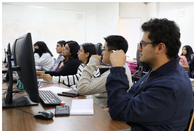
Maestría en Ciudades Educadoras y Docencia Intercultural en nuestra casa de estudios genera alternativas de solución a problemáticas de exclusión social

Las personas que deseen ingresar deben ser egresadas de una licenciatura en áreas afines a las ciencias sociales, humanidades y ciencias de la conducta; contar con un promedio mínimo de 8.0 (ocho punto cero); solicitar el ingreso por escrito a la Coordinación de Investigación y Posgrado e incluir una carta de exposición de motivos, entre otros requisitos.