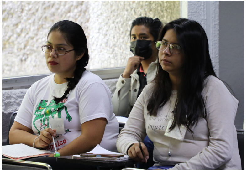
Estudiantes asistentes al curso intersemestral