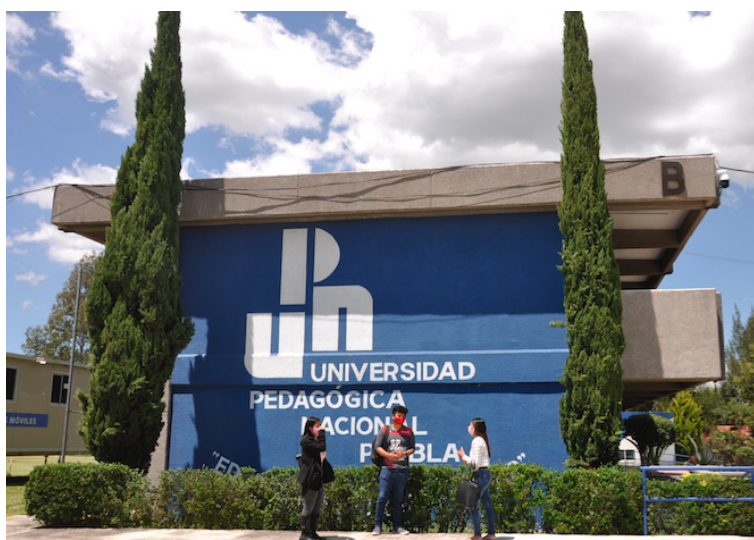
Nueva sede Puebla