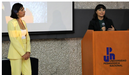
Las estudiantes galardonadas de nuestra casa de estudios