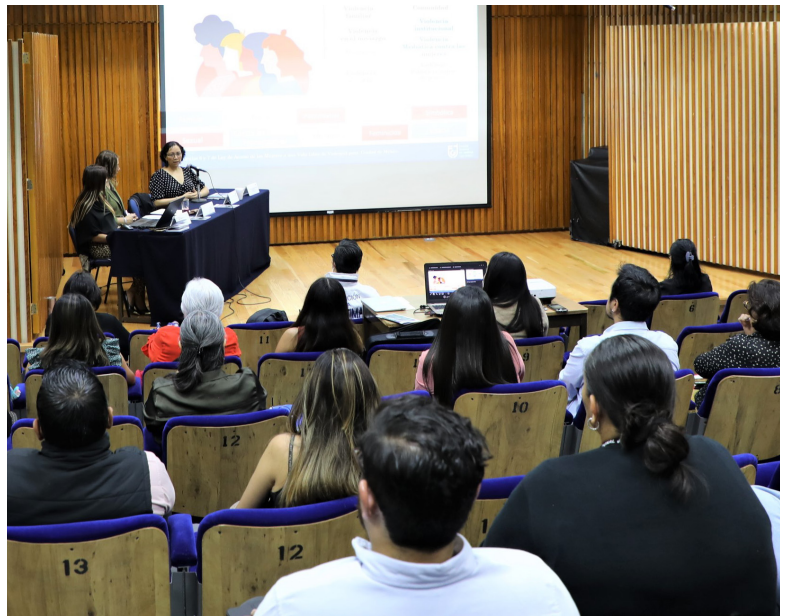
Taller Debida diligencia en la atención e investigación de la violencia sexual