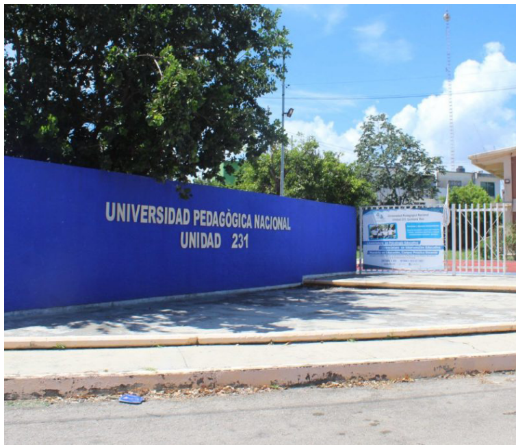
Unidad UPN 231, Chetumal