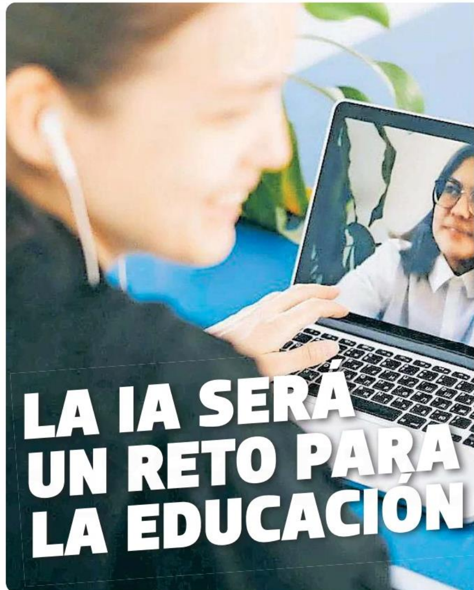
Las escuelas y docentes de buena parte del mundo se enfrentan a nuevos retos tecnológicos

Para la directora de Lexium, el problema de esto radica en el nivel de aprendizaje, que es lo que finalmente utilizan los alumnos para ob-