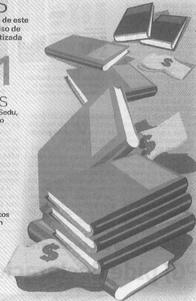
Ilustración: Daniel Rey

MIL jóvenes no lograron entrar a alguna prepa