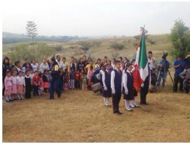
CON LA HEGEMONÍA de la Coordinadora Nacional de Trabajadores de la Educación, Oaxaca se convirtió en la entidad donde mejor pagaban a los maestros, pero también en segundo lugar nacional con mayor rezago educativo. Ahí el índice de analfabetismo es mayor a 16 por ciento y en promedio se pierden más de 70 días de clases en cada ciclo escolar. En el estado hay 483 maestros que cobraron durante los primeros tres meses de 2015 un sueldo superior a los 80 mil pesos mensuales, de acuerdo con los datos del primer trimestre de 2015 del Fondo de Aportaciones para la Nómina Educativa (Fone). Cuando en sus escuelas no había pisos firmes, techos, paredes... En la foto, el inicio de clases, ayer, en el jardín de niños Octavio Paz en San Pedro, Ixtlahuaca.

Pero Rubén Núñez anunció que los profesores de la Coordinadora se guiarán por el calendario escolar alterno, desarrollado por el propio gremio a partir del proyecto educativo que impulsa la CNTE, y así fue como el día de ayer las escuelas ubicadas en la ciudad