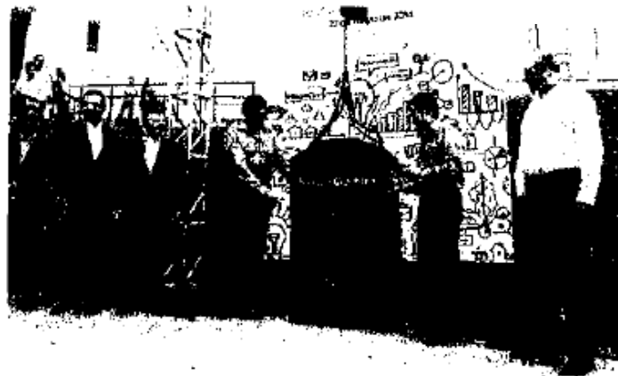
ESTRENO. El secretario de Economía, Idefonso Guajardo, y el gobernador Francisco Olvera, presidieron el acto

En su mensaje, el funcionario federal destacó el proyecto Ciudad del Conocimiento y la Cultura y dijo que "a través de la innovación se coadyuvará a la in-