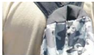
LOS COMPAÑEROS de Héctor Aleja

DENISSE no ha terminado sus estudios en la Normal de Tamaulipas; ocupa el cargo de su mamá aunque la reforma educativa no contempla la sucesión de puestos