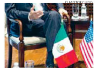
La visita del Secretario de Estado de EU, Jo sobre una relación bilateral en materia de e

No obstante, son metas ambiciosas—para no decir imposibles—dado el estado actual de movilidad estudiantil entre los dos países. Desde 2007, cuando el ex presidente Felipe Calderón lanzó una guerra contra los cárteles de drogas, el número de estadounidenses estudiando en México se ha desplomado—de unos 10,000 a 4,000 estudiantes, según el último reporte de IIE Open Doors. Como resultado, México ha dejado de ser el primer receptor de estudiantes estadounidenses en América Latina; hoy, ocupa el cuarto lugar, después de Costa Rica, Argentina y Brasil.