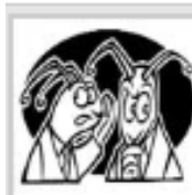
Pepe Grillo Cabilderos al acecho