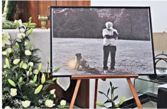
■ Una foto del periodista fue colocada en la capilla del panteón.