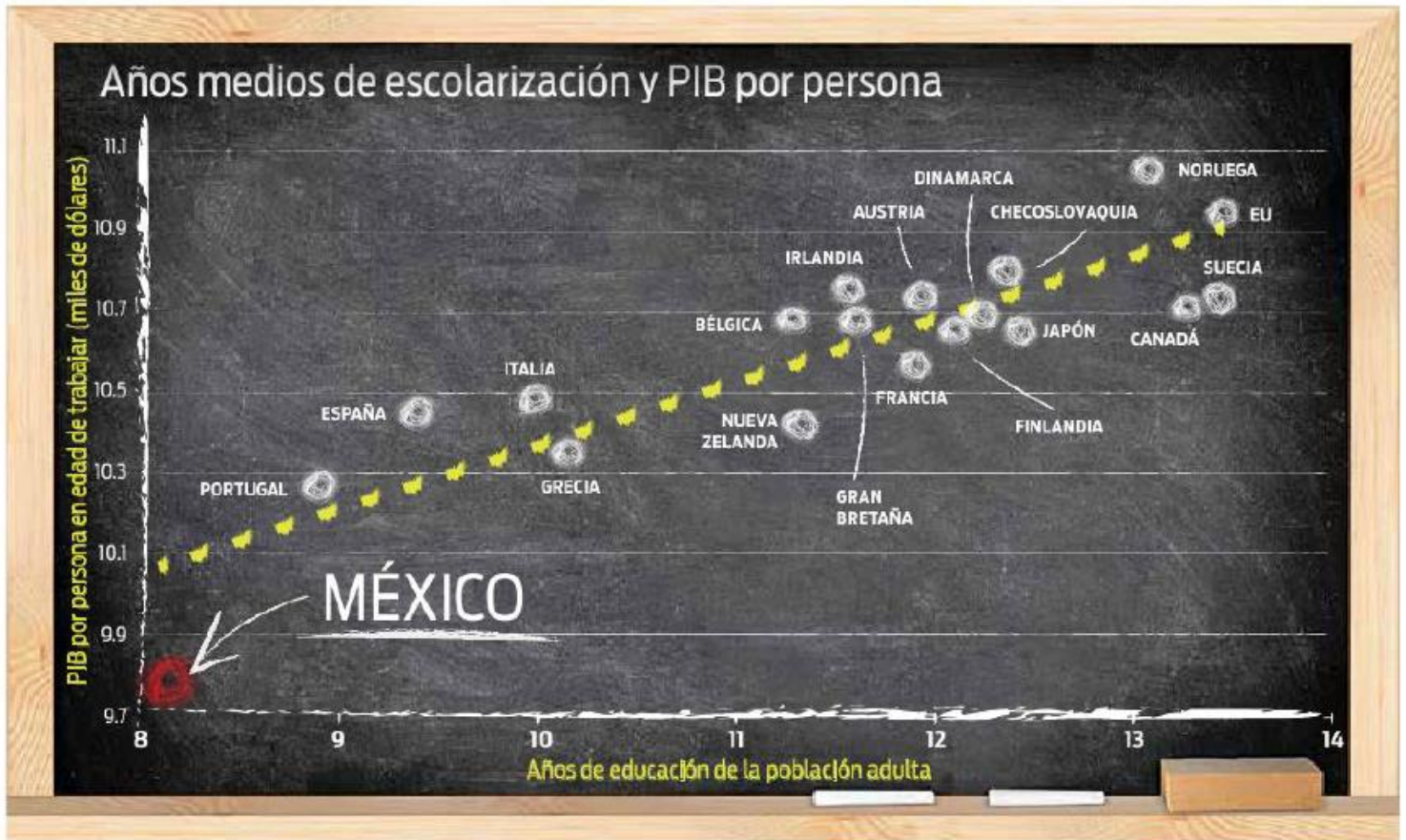
Gráfico: Luis Flores