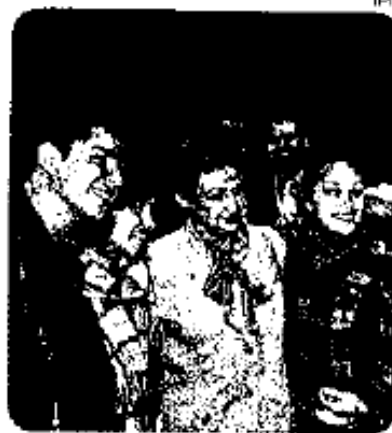
La directora general del IPN, Yoloxóchitl Bustamante Díez, con los estudiantes del programa de movilidad académica.

En tanto, 335 estudiantes de diferentes escuelas de esta casa de estudios realizarán estancias académicas en instituciones educativas nacionales e internacionales durante el mismo periodo.