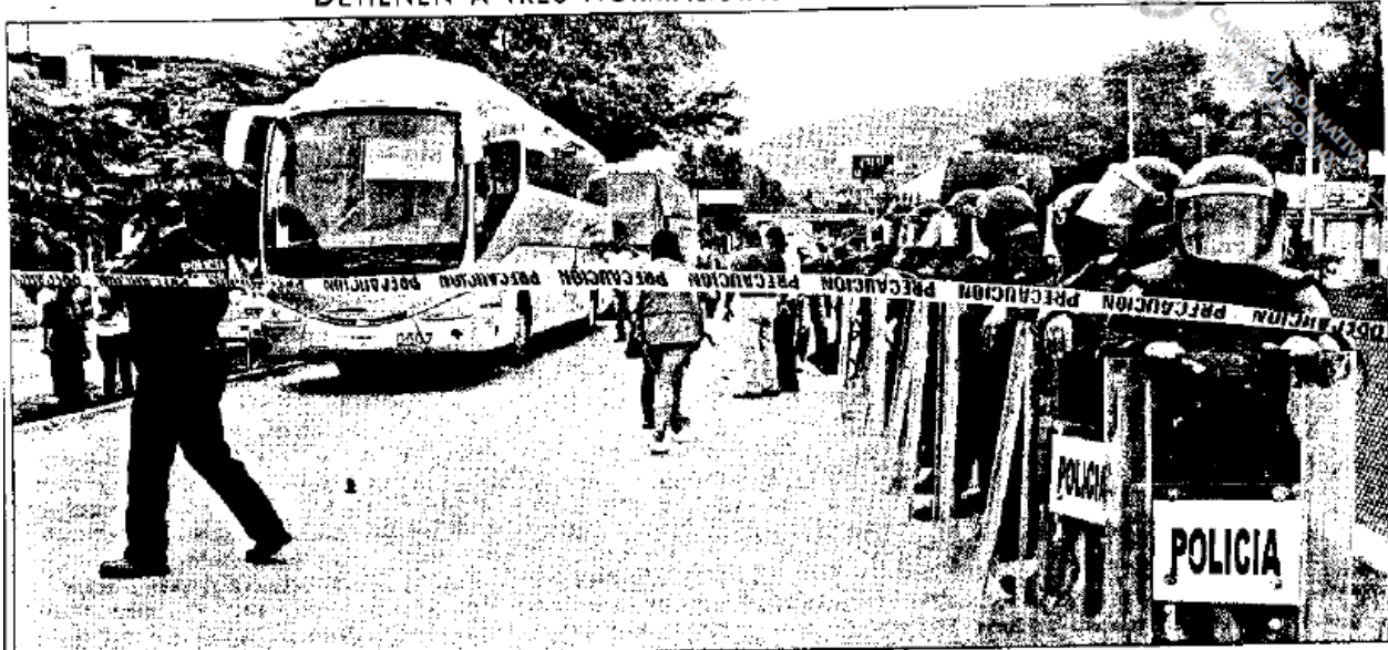
Policías estatales de Guerrero impidieron, por segundo día consecutivo, que alumnos de la Normal Rural de Ayotzinapa sacaran de la central de autobuses de Chilpancingo tres unidades en las cuales pretendían trasladar contingentes a la protesta del 14 de noviembre, cuando conmemorarán el desalojo realizado en el Congreso del estado en 2007. Tres jóvenes fueron consignados y, según los normalistas, hay cinco desaparecidos. Foto: Lenin Ocampo, con Información de Sergio Ocampo, corresponsal